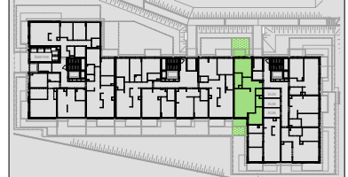
Lokalizacja mieszkania w budynku