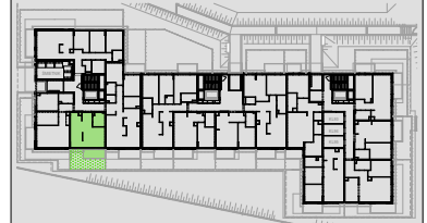
Lokalizacja mieszkania w budynku