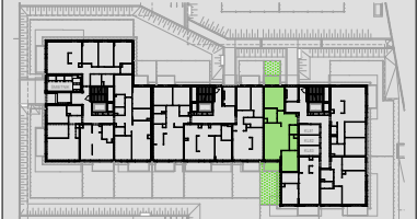
Lokalizacja mieszkania w budynku