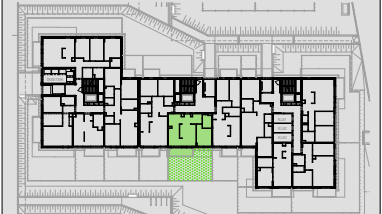
Lokalizacja mieszkania w budynku