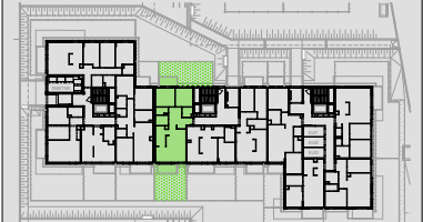
Lokalizacja mieszkania w budynku