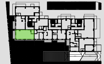
Lokalizacja mieszkania w budynku